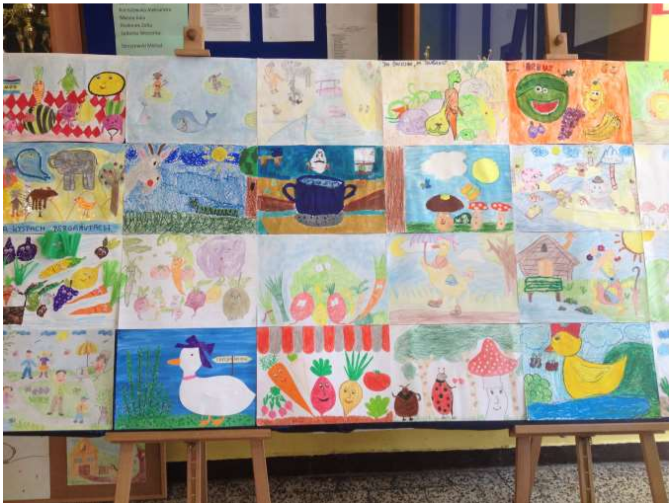
Prace uczniów klas I-III na konkurs plastyczny „Ilustracja do wybranego wiersza Jana Brzechwy”

Szkoła Podstawowa im. Jerzego Kukuczki w Sobiekursku, wydanie 7, maj 2016 r.